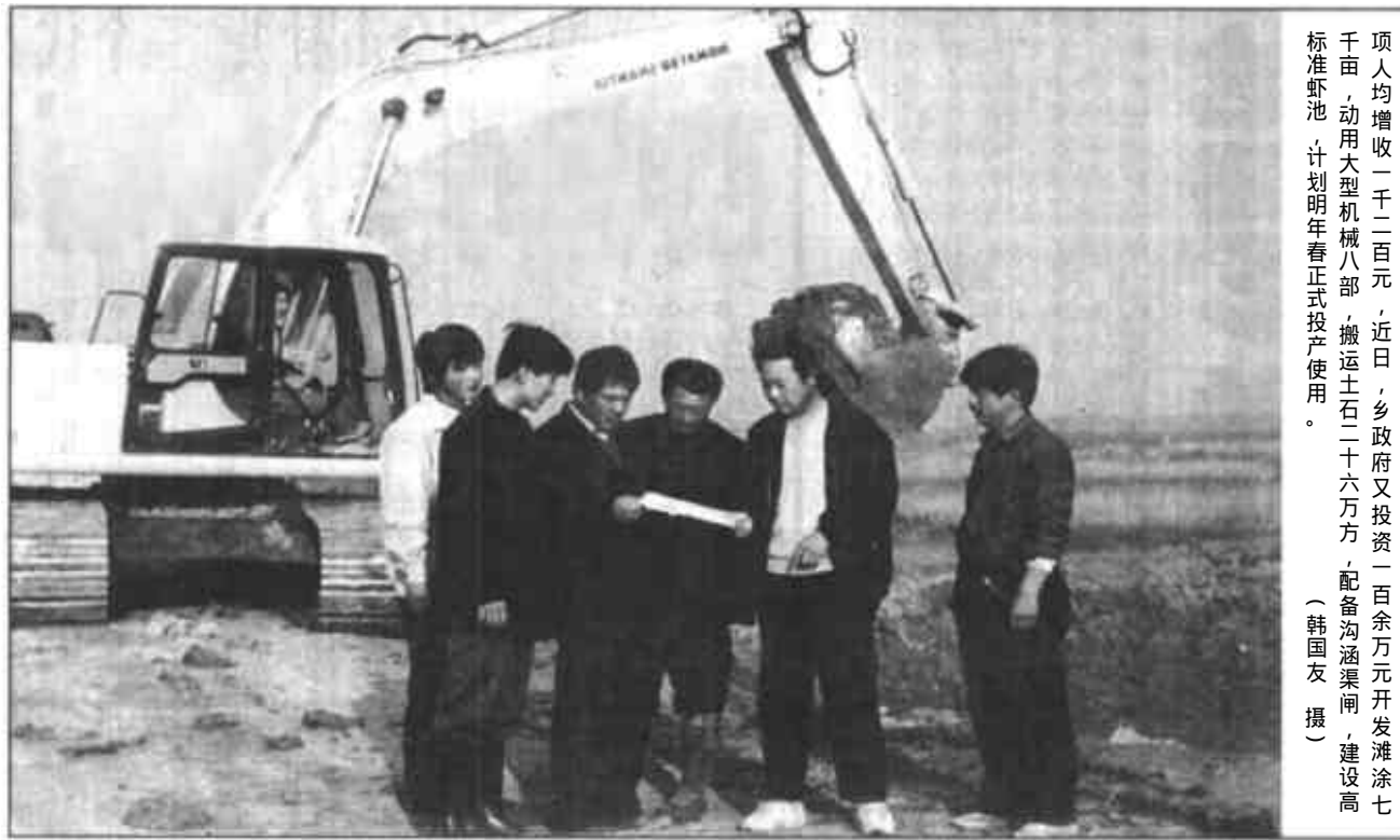
利津县刁口乡积极调整产业结构，大力发展海水特色养殖，仅此一项人均增收一千二百元...